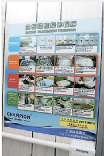
在當眼處張貼海報，有助食肆員工熟習操作洗碗碟機。