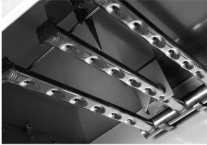
採用內凹式噴孔設計，防堵塞，加強清洗能力和擴闊噴洗範圍。 Debossed anti-clog nozzles provide powerful washing performance.