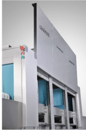
機頂，機身，及機門均為雙層不銹鋼板結構，保溫隔熱。 All stainless steel double wall construction of wash chambers and doors prevent heat loss.